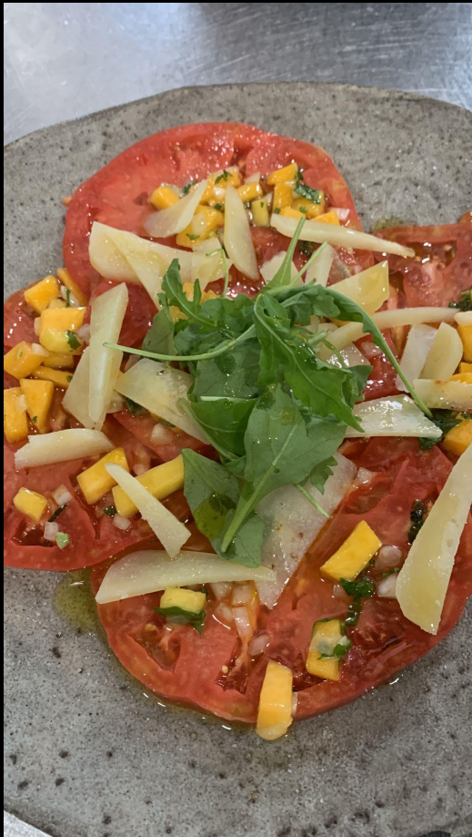
Carpaccio de tomate rosa, queso y Melocotón de Calanda (Restaurante Trasiego-Barbastro)